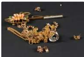
Lot n°69 Une bague en or 750/°°° et argent sup. à 800/°°°...