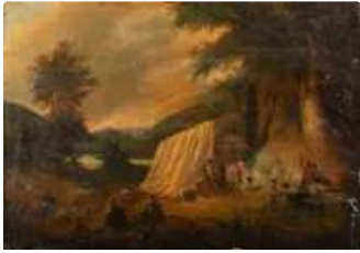
Lot n°149 École Française du XIXème siècle, dans la suite de...