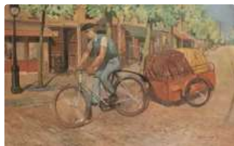
Lot n°210 PAUL VIVIEN (XXème) "Transport 41" Huile sur...