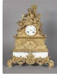
Lot n°323 Pendule dite "à sujet", en bronze doré et ciselé...