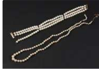
Lot n°35 Demi parure (à renfiler) or 750/°°° et perles de...