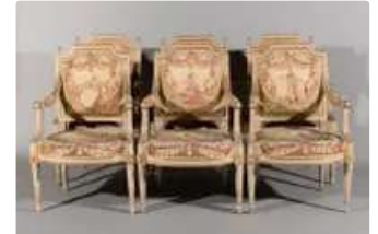
Lot n°268 Suite de six fauteuils en bois laqué gris et doré...