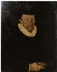
Lot n°137 BRUYN Bartholomaeus (Ecole de) Cologne vers 1530 -...