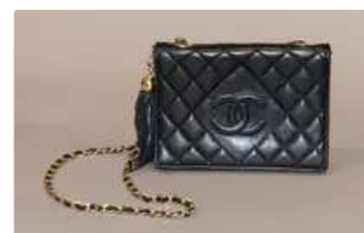
Lot n°80 CHANEL, vintage. Petit sac porté épaule en cuir...