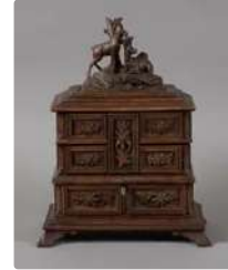
Lot n°328 Petit coffret à bijoux en noyer ouvrant par le haut...