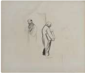
Lot n°165 Jean-Louis FORAIN (1852-1931) Étude de personnages...