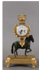
Lot n°271 Pendule au cheval en bronze ciselé à deux patines le...