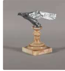
Lot n°371 Mascotte automobile ou bouchon de radiateur:...