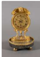
Lot n°334 Petite pendule en bronze ciselé et doré, le cadran à...