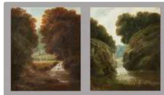
Lot n°170 Ecole française fin XIXème siècle deux paysages au...