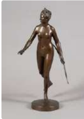
Lot n°265 Jean-Antoine HOUDON (1741-1828), d'après - Ferdinand...