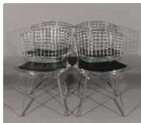
Lot n°402 Harry BERTOIA (1915-1978) & KNOLL (éditeur) Suite...