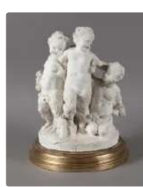
Lot n°263 Groupe en plâtre représentant une scène de...