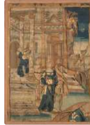
Lot n°247 Fragment de tapisserie du XVIIème siècle, à décor...