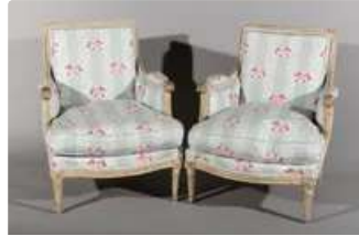
Lot n°242 Paire de bergères en bois mouluré sculpté laqué...