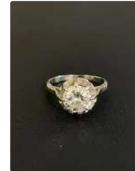
Lot n°40 Bague solitaire en or gris 750/°°° et platine sup. à...