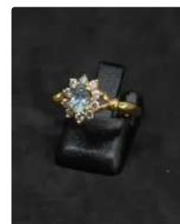
Lot n°12 Bague en or jaune 18 Kt 750/°°°, ornée d'une...