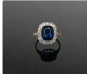
Lot n°39 Bague Pompadour en or jaune et platine sup. à...