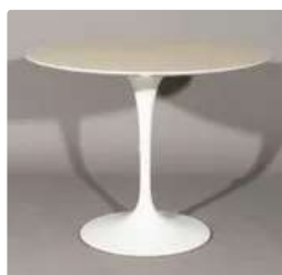
Lot n°415 Eero SAARINEN (d'après) Table d'après le modèle...