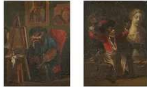
Lot n°150 WATTEAU Antoine (D'après) ...