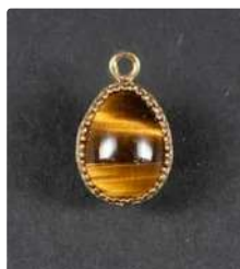
Lot n°10 Pendentif œuf, monture en or jaune 750/°°° retenant...