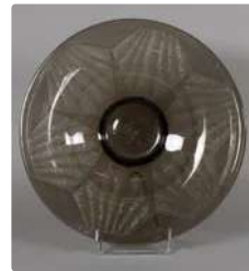
Lot n°379 Charles SCHNEIDER (1881 - 1953) - SCHNEIDER Coupe à...