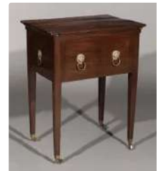
Lot n°336 Table volante en acajou et placage d'acajou et...