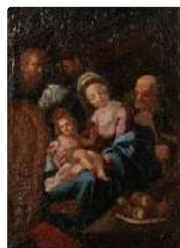
Lot n°142 AACHEN Hans Von (Suite de) ...