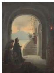
Lot n°158 ECOLE FRANCAISE Milieu du XIXe siècle ...