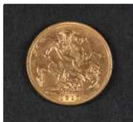
Lot n°75 1 souverain d'or 916/°°° Georges V 1917 pesant 7.97...