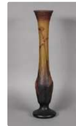
Lot n°380 DAUM - NANCY Vase balustre à long col conique sur...