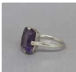
Lot n°13 Bague en or gris 750/°°° ornée d'une améthyste...