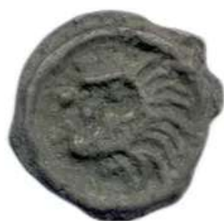
Lot n°77 SUESIONES Région de Soissons 60 - 30 Tête stylisée...