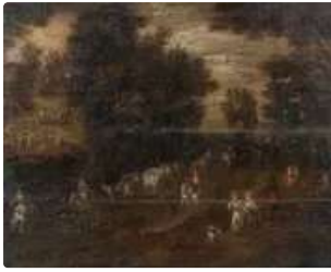
Lot n°145 BREUGHEL Jan II (Suite de) ...