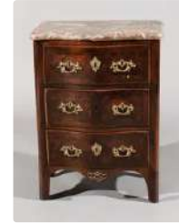
Lot n°244 Petite commode en placage de palissandre ouvrant à...