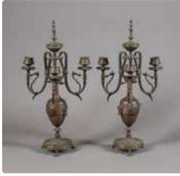
Lot n°321 Ferdinand BARBEDIENNE (1810-1892) Paire de...