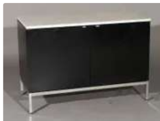
Lot n°403 Florence KNOLL (1917 - 2019) Buffet en bois teinté...