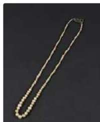
Lot n°71 Dans un écrin de montre signé sur le dessus Sandoz...