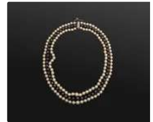
Lot n°44 Collier trois rangs de perles de culture en chute...