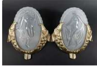
Lot n°386 MULLER FRERES LUNEVILLE Paire d'appliques en verre...