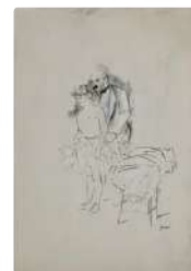
Lot n°160 Jean-Louis FORAIN (1852-1931) " Homme galant..."