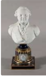
Lot n°273 Buste de Louis XVI en biscuit sur piédouche...