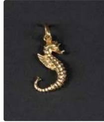
Lot n°50 Pendentif en or jaune 750/°°° représentant un...