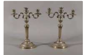
Lot n°252 Paire de flambeaux formant candélabres à trois bras...