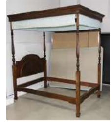
Lot n°324 Lit à baldaquin en bois teinté, à décor sculpté de...