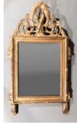
Lot n°326 Miroir à fronton ajouré en bois sculpté et doré à...