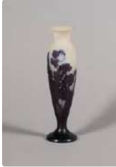
Lot n°389 Vase soliflore en verre multi couches, le décor...