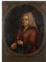
Lot n°138 ECOLE FLAMANDE (Bruges ?) Première Moitié du XVIe...