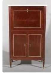
Lot n°275 Petit secrétaire droit d'enfant en placage d'acajou,...