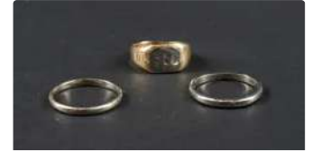
Lot n°36 Bague chevalière en or jaune 750/°°° (pesant 6.10...