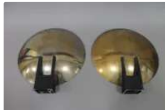
Lot n°398 Pierre DISDEROT pour SOKA Paire d'appliques en métal...