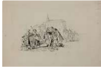
Lot n°134 ECOLE ESPAGNOLE Première Moitié du XIXe siècle ...