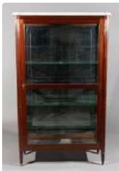
Lot n°269 Vitrine en acajou de style Louis XVI, à une portes,...