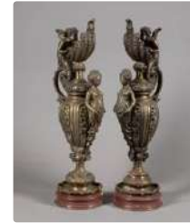
Lot n°280 Paire d'aiguières simulées à l'antique en bronze...