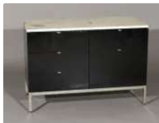
Lot n°407 Florence KNOLL (1917-2019) & KNOLL INTERNATIONAL...