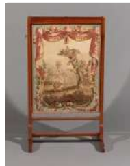
Lot n°270 Écran de cheminée en bois mouluré sculpté vernis, a...