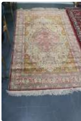
Lot n°249 Tapis en laine et soie CESARE à fond jaune et rose,...