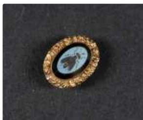
Lot n°11 Bouton de col en or jaune 750/°°° ciselé retenant...