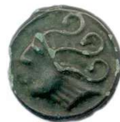
Lot n°76 DUROCASSES Région de Dreux 80 - 50 Tête stylisée à...