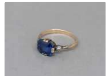
Lot n°48 Bague en or rose 585/°°°, ornée d'un saphir de...