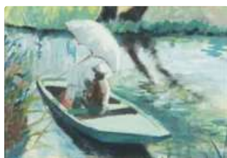
Lot n°206 BROUAL (XXème siècle) Le peintre Constant DUVAL...