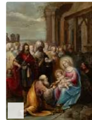
Lot n°140 FRANCKEN Frans II dit le Jeune (Atelier de) ...