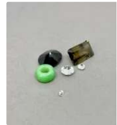
Lot n°60 Ensemble de pierres sur papier : un diamant rond de...