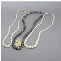
Lot n°61 Sachet contenant trois colliers : deux colliers en...