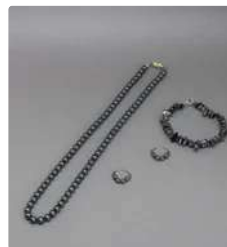
Lot n°63 Parure composée de perles d'hématite comprenant un...