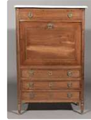
Lot n°260 Secrétaire droit en acajou et placage d'acajou...