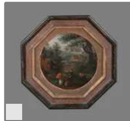
Lot n°139 GRIMMER Abel (Attribué à) ...