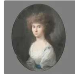
Lot n°136 ECOLE FRANCAISE Premier Tiers du XIXe siècle ...