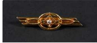
Lot n°51 Broche barrette en fils d'or jaune 585/°°° centrée...