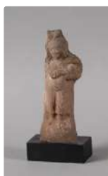
Lot n°223 Statuette d'Harpocrate de style antique romain,...