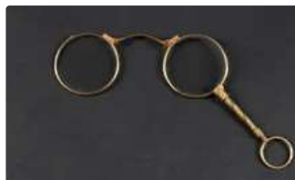
Lot n°67 Lorgnons en métal doré ciselé, portant un poinçon de...