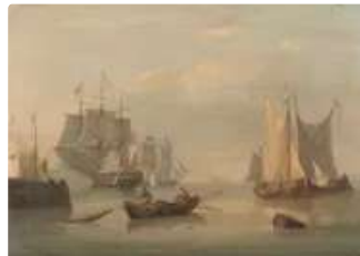
Lot n°154 ANDERSON William (Entourage de) ...