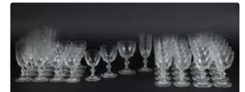
Lot n°284 LALIQUE France Modèle Chambord Partie de service...