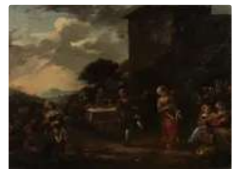
Lot n°144 ECOLE DES BAMBOCCIANTI ...