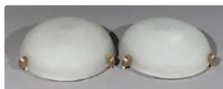
Lot n°411 JEAN PERZEL (1892-1986) Paire de plafonniers,...