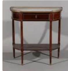
Lot n°267 Console demi-lune en acajou et placage d'acajou...