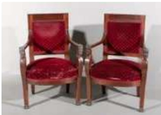
Lot n°333 Paire de fauteuils en acajou et placage d'acajou «...