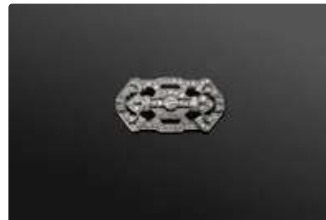
Lot n°43 Broche plaque Art Déco en platine sup. à 800/°°° et...