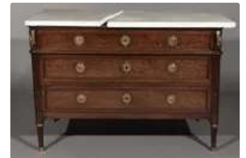
Lot n°256 Commode en acajou et placage d'acajou moucheté...