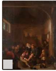
Lot n°146 MOLENAER Jan Miense ...