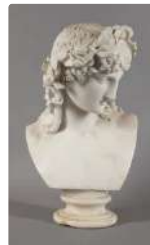
Lot n°287 Buste de bacchus ou Appolon en marbre blanc, la tête...