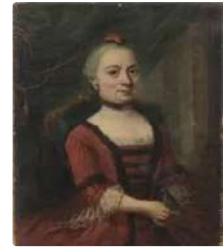
Lot n°148 CABAILLE ...