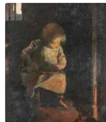
Lot n°175 Jean ULYSSE-ROY (XIX-XXème siècle) petite fille...