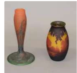
Lot n°384 MULLER FRERES LUNEVILLE Vase en verre marmoréen...