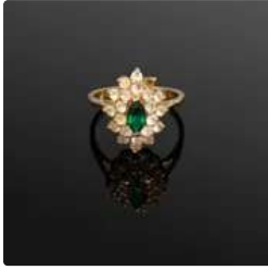
Lot n°33 Bague Marquise en or jaune 375/°°° centrée d'une...