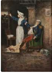
Lot n°177 J. LAURAND Soldat blessé Huile sur toile Signée...