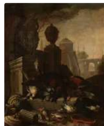
Lot n°143 WEENIX Jan (Ecole de) Amsterdam 1642 - 1719 Trophée...