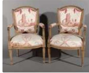
Lot n°259 Paire de fauteuils cabriolets en bois laqué gris...