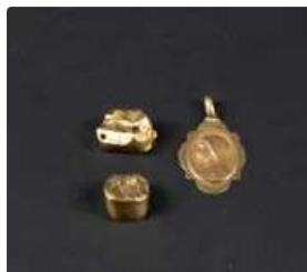
Lot n°1 Médaille religieuse à la Vierge en or jaune 750/°°°...