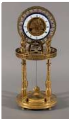
Lot n°285 Pendule squelette en bronze ciselé et doré, le...