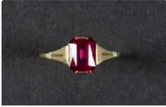
Lot n°49 Bague en or jaune 750/°°°, ornée d'un rubis de...