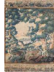
Lot n°248 AUBUSSON Tapisserie en laine et soie du XVIIIème...