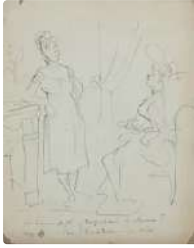
Lot n°161 Jean-Louis FORAIN (1852-1931) " Comment, tu as trop..."