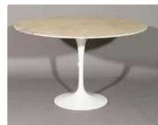
Lot n°416 Eero SAARINEN (d'après) Table de salle à manger...