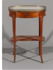
Lot n°246 Petite table de salon formant écritoire en bois...