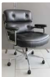
Lot n°427 Charles et Ray EAMES (XXe) - édition VITRA Modèle...