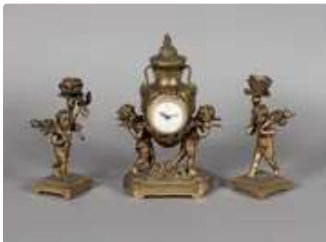
Lot n°281 Garniture de cheminée en bronze doré et ciselé aux...