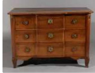
Lot n°327 Commode en noyer à ressaut central ouvrant à cinq...