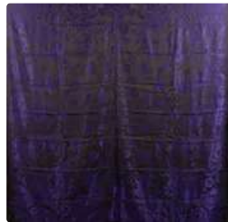
Lot n°250 Châle austro Hongrois, fin XIXème siècle, damas vert...