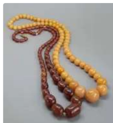
Lot n°66 Deux longs colliers en chute de perles couleur brune...