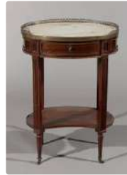
Lot n°279 Petite table de salon formant écritoire de forme...