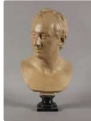
Lot n°266 D'après Jean-Antoine HOUDON (1741-1828) Buste en...