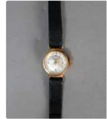
Lot n°56 Vermont. Montre de dame boîtier rond en or rose...