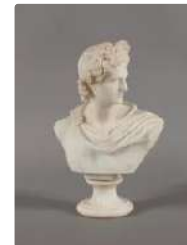
Lot n°288 Buste en marbre blanc sur piédouche circulaire...