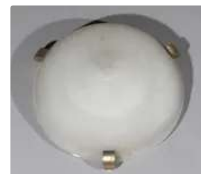
Lot n°412 JEAN PERZEL (1892-1986) Plafonnier, modèle n°2004...