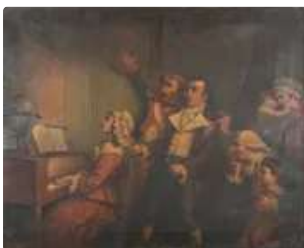
Lot n°157 DETOUCHE Laurent Didier ...