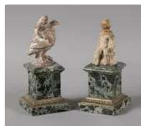
Lot n°224 Deux statuettes en terre cuite, de style antique...