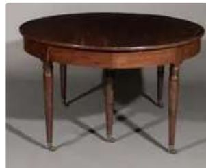
Lot n°255 Table de salle à manger en acajou et placage...