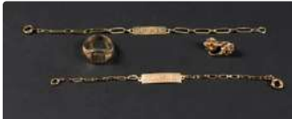
Lot n°37 Lot en or jaune 750/°°° et platine (pour la...