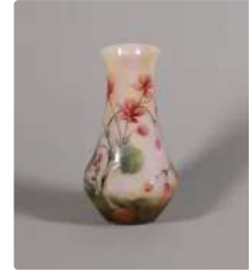
Lot n°388 DAUM - NANCY Vase ovoïde à col tubulaire conique...