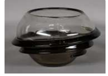
Lot n°376 Charles SCHNEIDER (1881 - 1953) - SCHNEIDER Vase à...