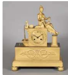
Lot n°331 Pendule à sujet en bronze ciselé et doré « la jeune...