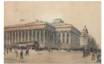
Lot n°188 FRANK-BOGGS (1855-1926) La Bourse à Paris,...