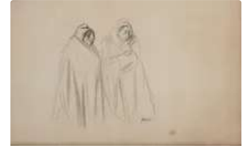
Lot n°164 Jean-Louis FORAIN (1852-1931) Deux personnages en...