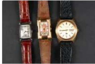
Lot n°54 Trois montres bracelets vintage en l'état ...