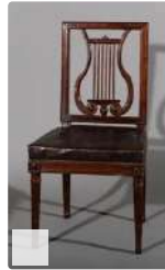
Lot n°278 Chaise en acajou à dossier Lyre aux montants en...