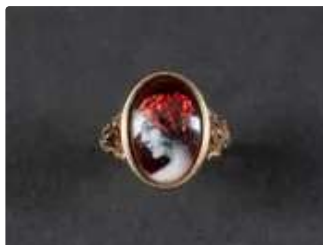
Lot n°3 Bague en or jaune 750/°°° au chaton ovale orné d'un...