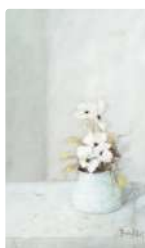
Lot n°207 Jean BAUCHESNE (1924) Bouquet de fleurs dans un...