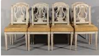
Lot n°261 Suite de huit chaises à dossier Lyre à cinq cordes...