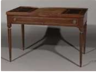
Lot n°257 Table à jeux de tric trac de forme rectangulaire en...