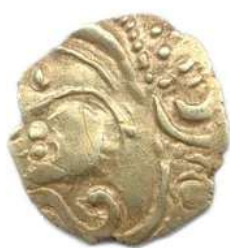
Lot n°78 AULERCI EBURUVICES Région d'Evreux 60 - 50 Tête...