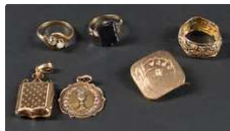
Lot n°46 Ensemble de bijoux anciens en or jaune 750/°°° en...