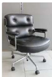
Lot n°426 Charles et Ray EAMES (XXe) - édition VITRA Modèle...