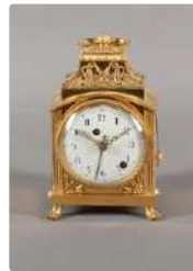
Lot n°251 Pendulette de voyage en bronze ciselé et doré, le...