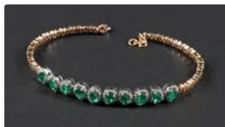
Lot n°6 Bracelet jonc en or deux tons 750/°°° orné de 10...