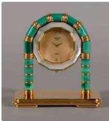
Lot n°393 FABERGE Paris Pendulette de bureau à quartz, en...