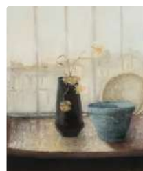
Lot n°208 Jean BAUCHESNE (1924) "Nature morte à la chaise...