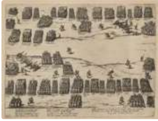
Lot n°129 La Bataille d'Ivry, 14 mars 1590 Gravure en noir du...