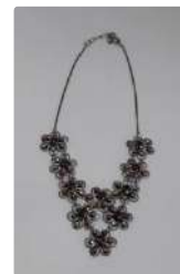
Lot n°64 Ecrin signé Louis Carat contenant : -un collier...