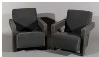
Lot n°421 Gerry Thomas RIETVELD (1888 - 1964) & CASSINA...