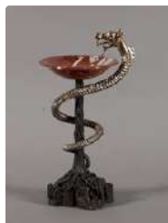
Lot n°401 Salvador DALI (1904-1989) Caducée II Epreuve en...