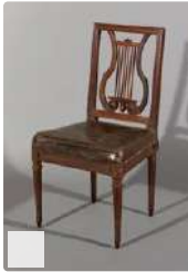
Lot n°277 Chaise en acajou à dossier lyre aux montants en...