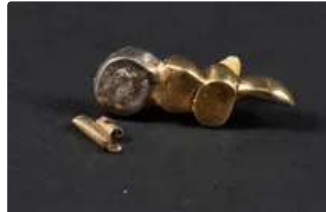
Lot n°38 Débris dentaires d'or et d'alliage. Poids brut...