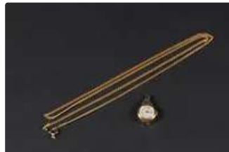
Lot n°58 Boîtier de montre en or trois tons 750/°°° monté en...