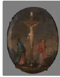
Lot n°147 ECOLE FRANCAISE ...