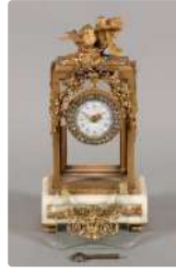
Lot n°322 Pendulette en bronze doré et marbre blanc de style...