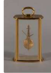
Lot n°392 JAEGER LECOULTRE Pendulette de bureau en métal doré...