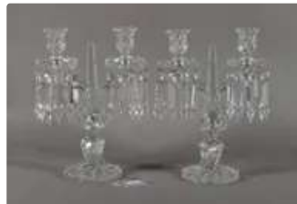
Lot n°282 BACCARAT Paire de girandoles à deux bras de...