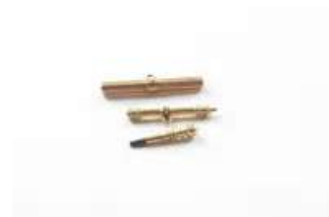
Lot n°8 Trois pendentifs de chaîne formant des clés pour...