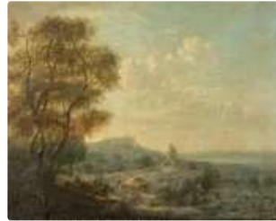
Lot n°151 BRUANDET Lazare (Attribué à) ...