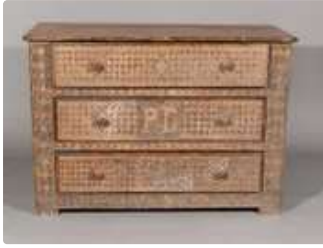
Lot n°369 Commode rectangulaire en bois naturel, ouvrant par...