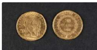
Lot n°74 Deux pièces 20F or 900/°°° Génie 1895 A et au Coq...