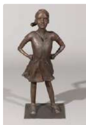
Lot n°425 Ecole contemporaine "Fearless Serena" Statue en...