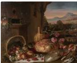
Lot n°141 ECOLE Allemande de la fin du XVIIème siècle Nature...