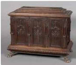
Lot n°329 Coffret en noyer de forme rectangulaire à décor...