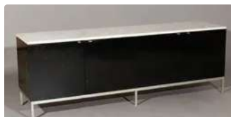
Lot n°405 Florence KNOLL (1917-2019) & KNOLL INTERNATIONAL...