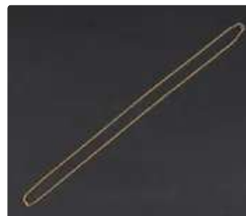
Lot n°47 Longue chaîne en or jaune 750/°°° à maillons forçat...