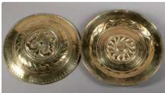
Lot n°253 Deux plats à offrandes en cuivre repoussé, l'un à...