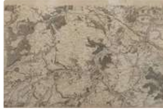
Lot n°130 Plan de Dreux et sa région Gravure du XIXème...