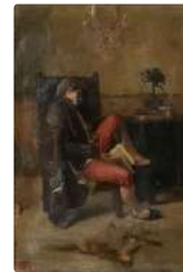
Lot n°156 VIBERT Jean - Georges (Attribué à) ...