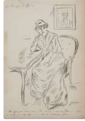
Lot n°162 Jean-Louis FORAIN (1852-1931) " Les Temps..."