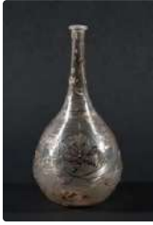
Lot n°385 Émile GALLE (1846-1904) Bouteille à long col...