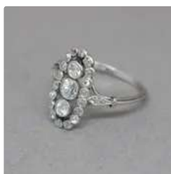
Lot n°15 Bague Art Déco en platine sup. à 800/°°° et or gris...