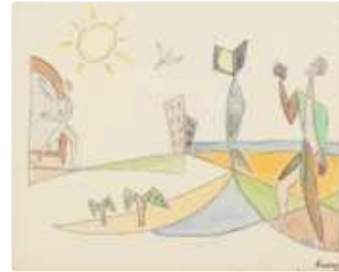
Lot n°167 Léopold SURVAGE (1879-1968) "Hommes dans la..."