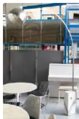
Lot n°417 Achile & Pier CASTIGLIONI (designer) & FLOS...