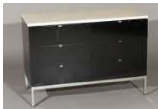
Lot n°406 Florence KNOLL (1917-2019) & KNOLL INTERNATIONAL...