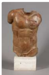
Lot n°423 Igor MITORAJ (1944-2014) Torse acéphale modèle...