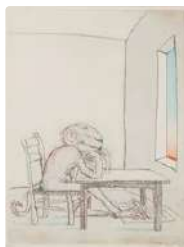
Lot n°211 André FRANÇOIS (1915-2005) Sans titre Lithographie...