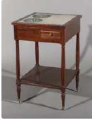
Lot n°325 Rafraichissoir en acajou et placage d'acajou à deux...