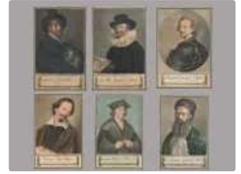
Lot n°132 Série de six gravures représentant des autoportraits...