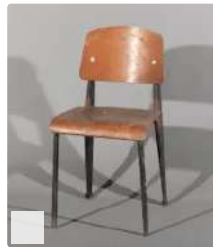
Lot n°394 Jean PROUVÉ (1901 - 1984) Chaise, modèle 305 du...