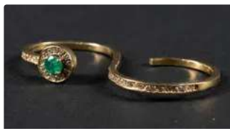
Lot n°7 Bague deux doigts formant un double anneau en or...