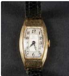
Lot n°57 OMEGA. Montre bracelet de dame, boîtier de forme...