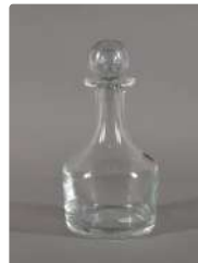
Lot n°283 SAINT-LOUIS carafe et son bouchon en cristal,...