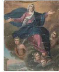
Lot n°152 ECOLE FRANCAISE du XIXe siècle L'Assomption de la...