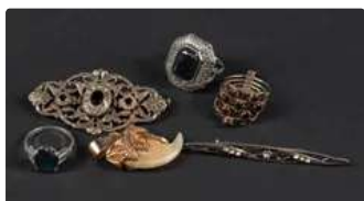
Lot n°73 Lot de bijoux fantaisie anciens en métal et argent...