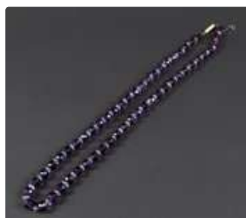
Lot n°9 Collier de billes facettées d'améthyste alternées de...