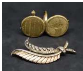
Lot n°2 Deux bijoux en vermeil sup. à 800/°°° 1930-1960 :...