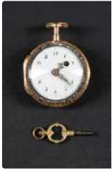
Lot n°53 Montre de poche 1750-1780 en or deux tons 750/°°° et...