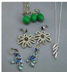
Lot n°65 Lot de bijoux fantaisie dont 2 paires de boucles...