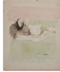
Lot n°163 Jean-Louis FORAIN (1852-1931) " Un homme sans..."