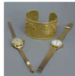
Lot n°68 Lot de bijoux fantaisie : un bracelet manchette...