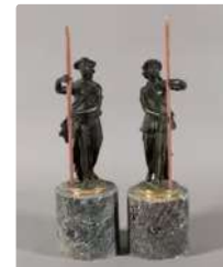
Lot n°272 Deux statuettes en pendant en bronze à patine foncée...