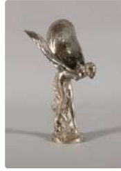
Lot n°370 Mascotte Automobile : Spirit of Ecstasy, mascotte...