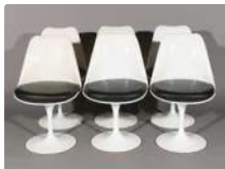
Lot n°418 Eero SAARINEN (d'après) Suite de six chaises...