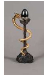
Lot n°400 Salvador DALI (1904-1989), d'après Caducée...