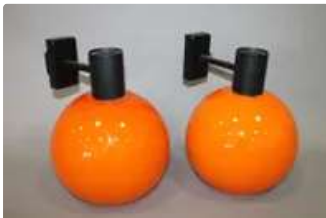
Lot n°397 Paire d'appliques murales de marque PARSCOT en verre...