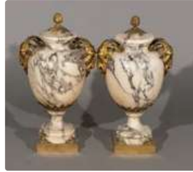
Lot n°274 Paire de vases couverts à l'antique", en marbre...