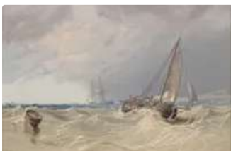
Lot n°173 Samuel JACKSON...