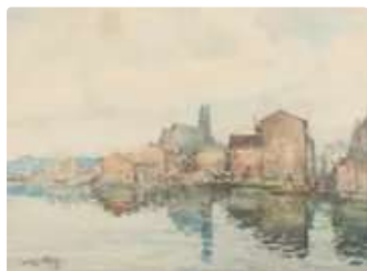
Lot n°197 École moderne Vue des bords d'un fleuve aquarelle...