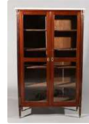
Lot n°276 Bibliothèque en acajou à deux portes vitrées, les...