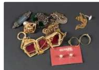
Lot n°72 Une pochette en toile logotée et une boîte Must de...