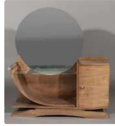
Lot n°387 TRAVAIL FRANCAIS VERS 1940 Coiffeuse de forme...