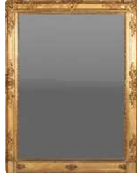
Lot n°258 Miroir de cheminée en bois et stuc doré à motifs de...