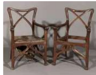
Lot n°383 Eugène GAILLARD (attribué à) Paire de fauteuils en...