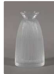
Lot n°396 CRISTAL LALIQUE Vase à corps conique entièrement...