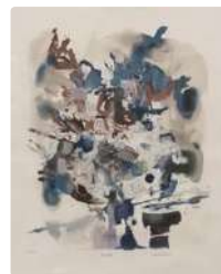
Lot n°212 François BARON-RENOUARD...