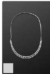
Lot n°42 Collier draperie en or blanc 750/°°° composé de deux...