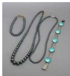
Lot n°62 Sachet contenant : deux colliers de perles...