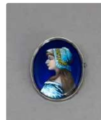
Lot n°4 D'après C. Fauré. Broche en argent 800/°°° ornée...