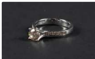
Lot n°5 Bague solitaire en or blanc 750/°°°, ornée d'un...