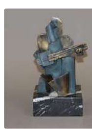
Lot n°391 Luis Miguel Urrea GUIA (XXème siècle) Le...