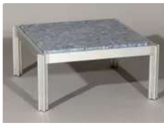
Lot n°419 Georges CIANCIMINO (né en 1928) & MOBILIER...