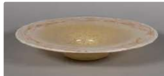
Lot n°378 Charles SCHNEIDER (1881 - 1953) - SCHNEIDER Coupe à...