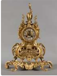
Lot n°241 Pendule en bronze ciselé et doré de style Rocaillle...