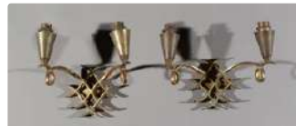
Lot n°395 TRAVAIL FRANÇAIS 1940 Paire d'appliques en bronze...