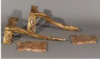
Lot n°245 Paire de consoles en bois et stuc redoré à décor de...