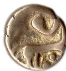
Lot n°79 REMI Région de Reims 80 - 50 Les trois segments...