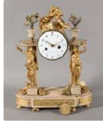
Lot n°262 Pendule portique en bronze doré et marbre blanc, le...