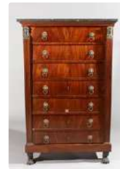
Lot n°332 Semainier en acajou ouvrant à sept tiroirs, dessus...