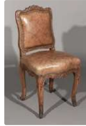
Lot n°243 Chaise en bois ciré patiné sculpté le dossier centré...