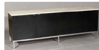
Lot n°404 Florence KNOLL (1917-2019) & KNOLL INTERNATIONAL...