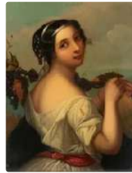
Lot n°155 BROCHART Constant Joseph (Attribué à) ...