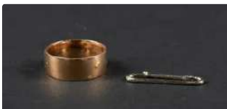
Lot n°45 Lot en or jaune et blanc 750/°°° comprenant une...