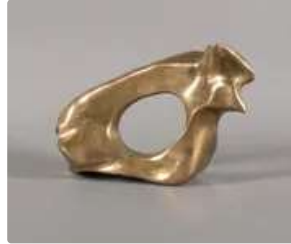
Lot n°390 James MERCURIN (né en 1942) sans titre Epreuve en...