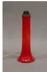
Lot n°399 Pied de lampe en verre opalin rouge, Éditeur LUXUS,...