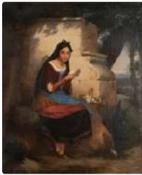
Lot n°153 ECOLE FRANCAISE Première Moitié du XIXe siècle ...