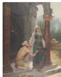
Lot n°159 Ecole Française orientaliste vers 1900/1920 Homme...