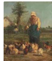
Lot n°176 Ecole Française vers 1900 La paysanne jetant des...