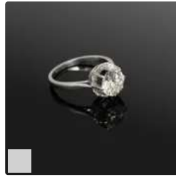
Lot n°34 Bague solitaire en platine 950/°°° ornée d'un...