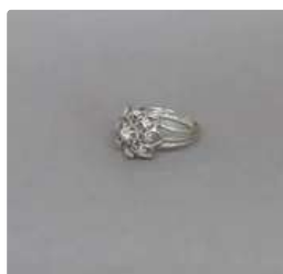
Lot n°14 Bague fleur en or gris 750/°°° et platine ornée de...